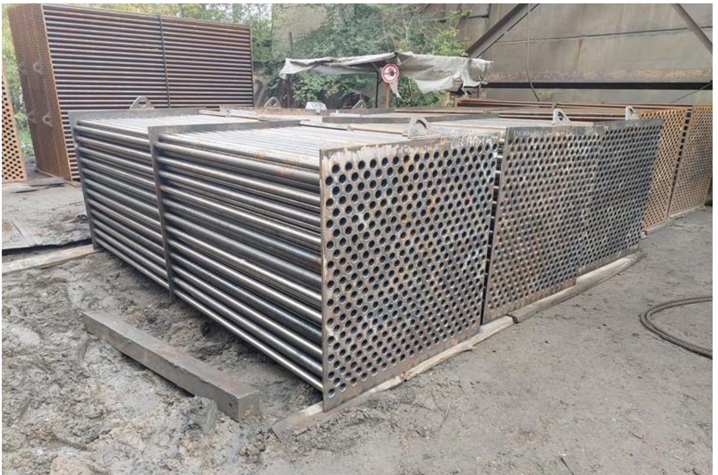
Фото 4 – Складирование, подготовка кубов к монтажу