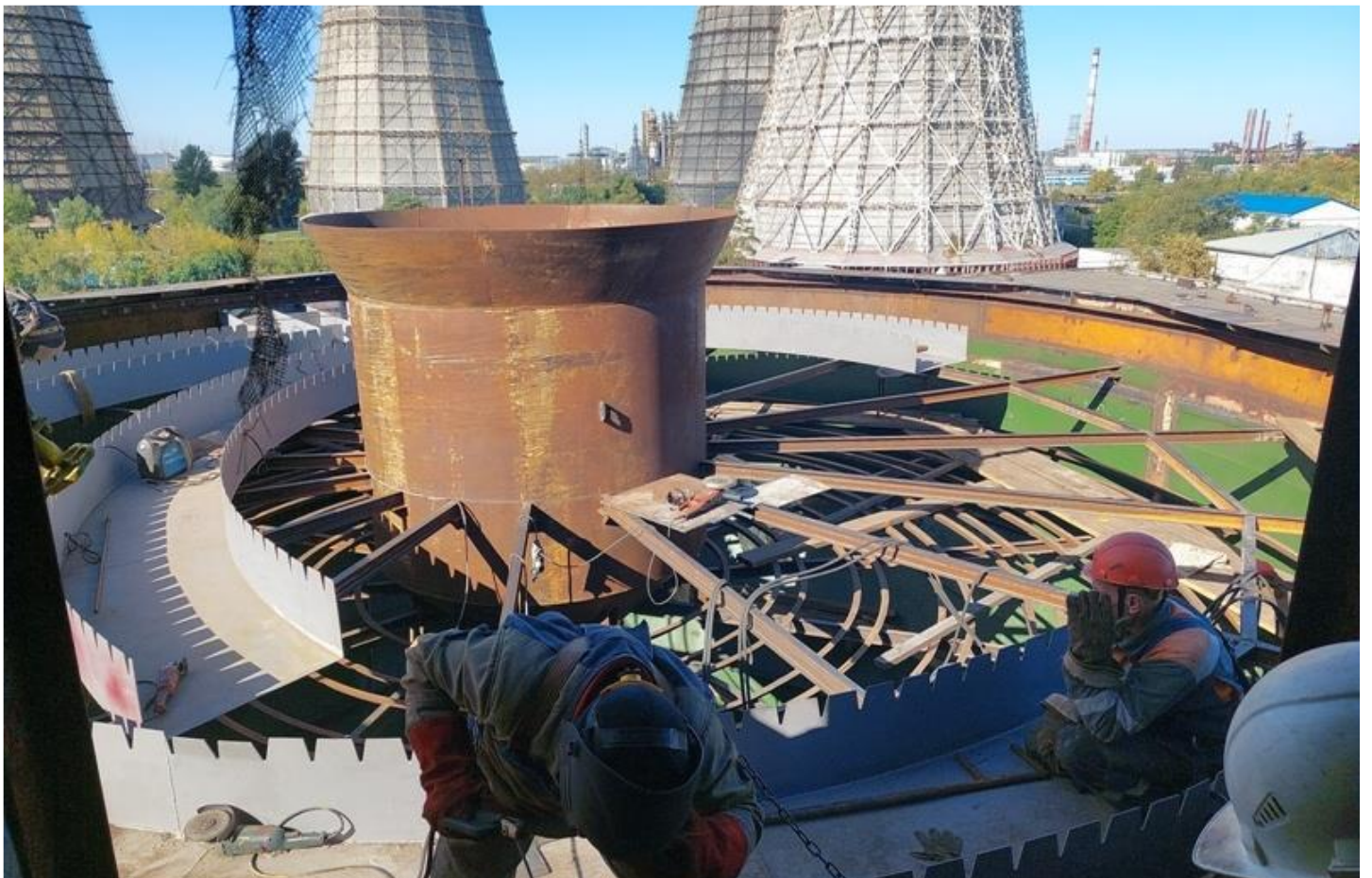
Фото 18 – Монтаж внутренних узлов осветителя