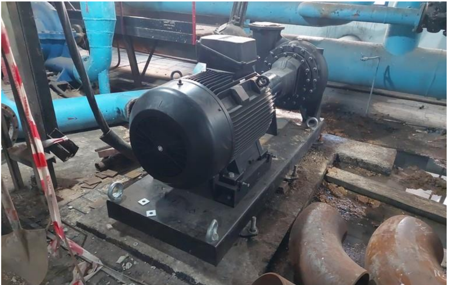
Фото 13 – Монтаж насоса