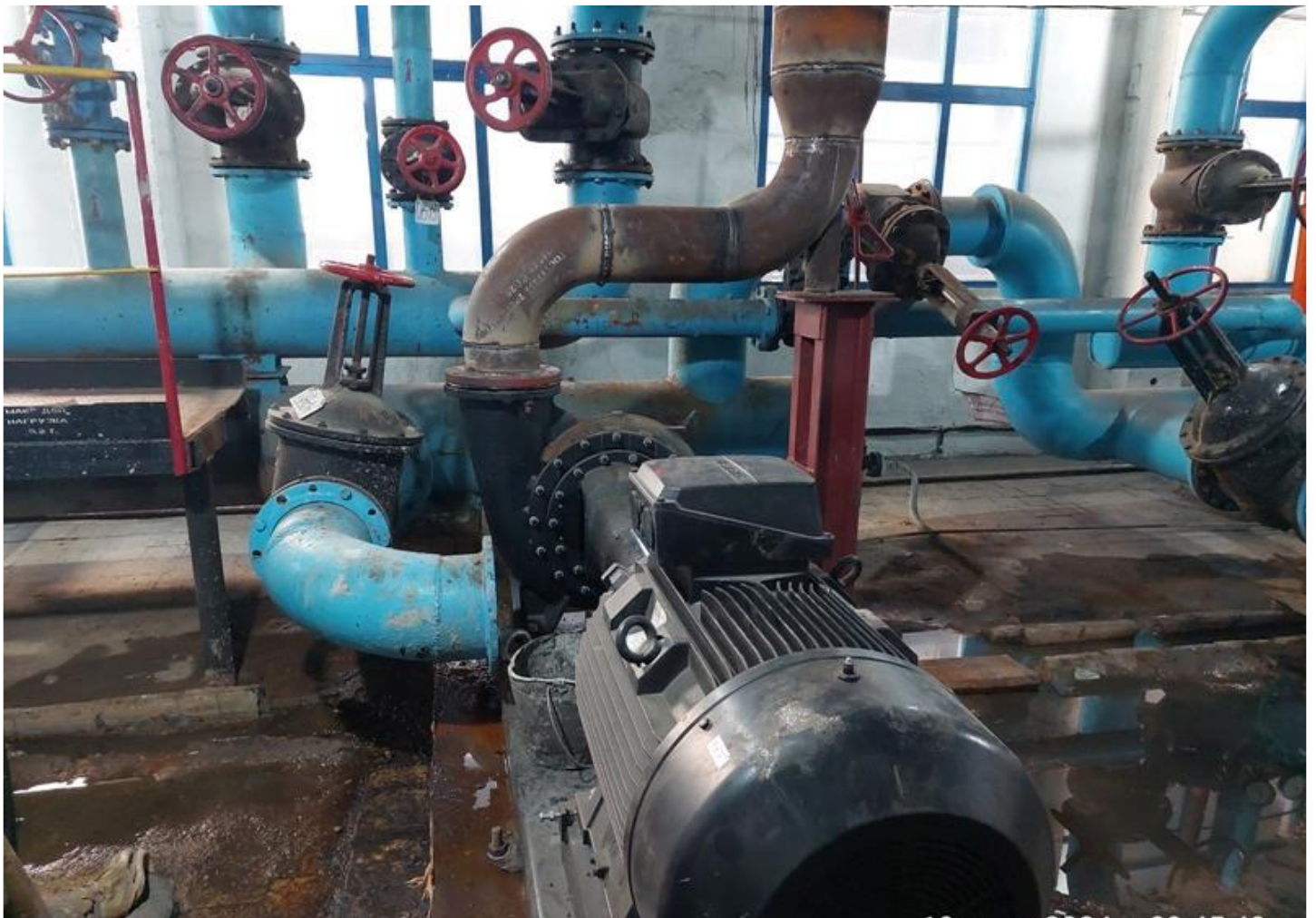
Фото 14 – Обвязка трубопроводом насоса