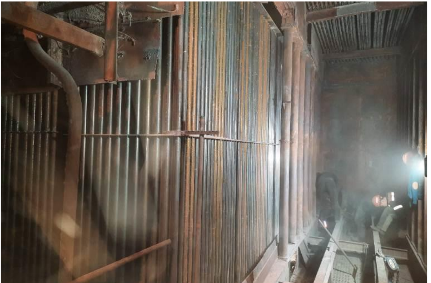
Фото 6 – Монтаж кубов