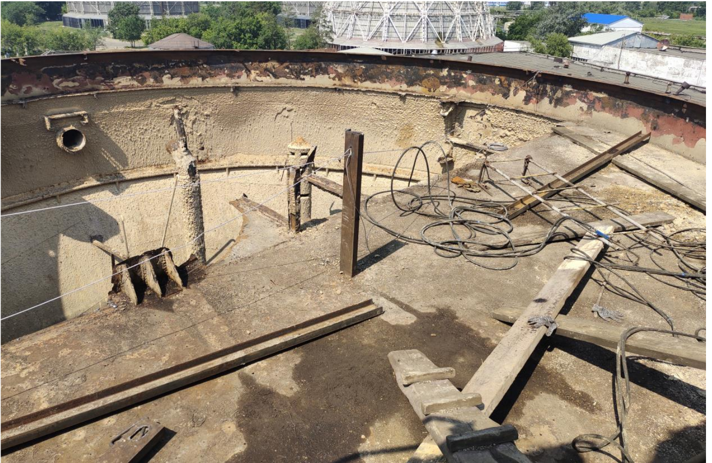
Фото 7 – Демонтаж дефектных металлоконструкции осветителя