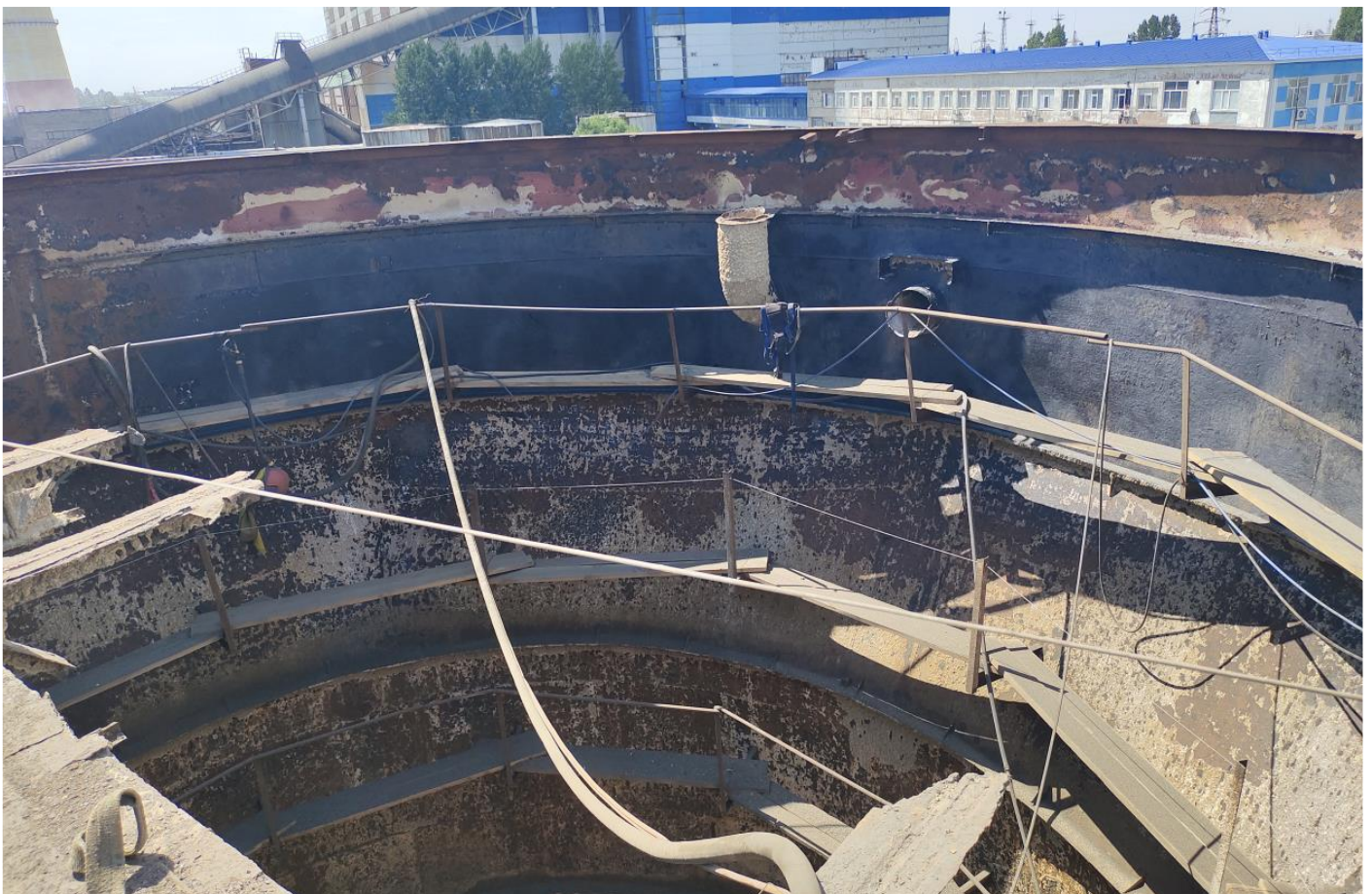
Фото 10 – Пескоструйные работы по очистке коррозии металла существующего корпуса осветителя №1.