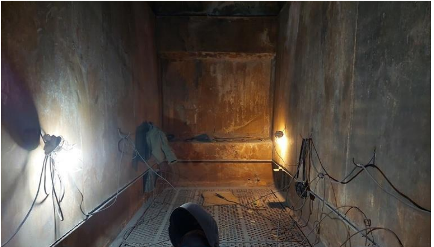
Фото 3 – Обварка кубов