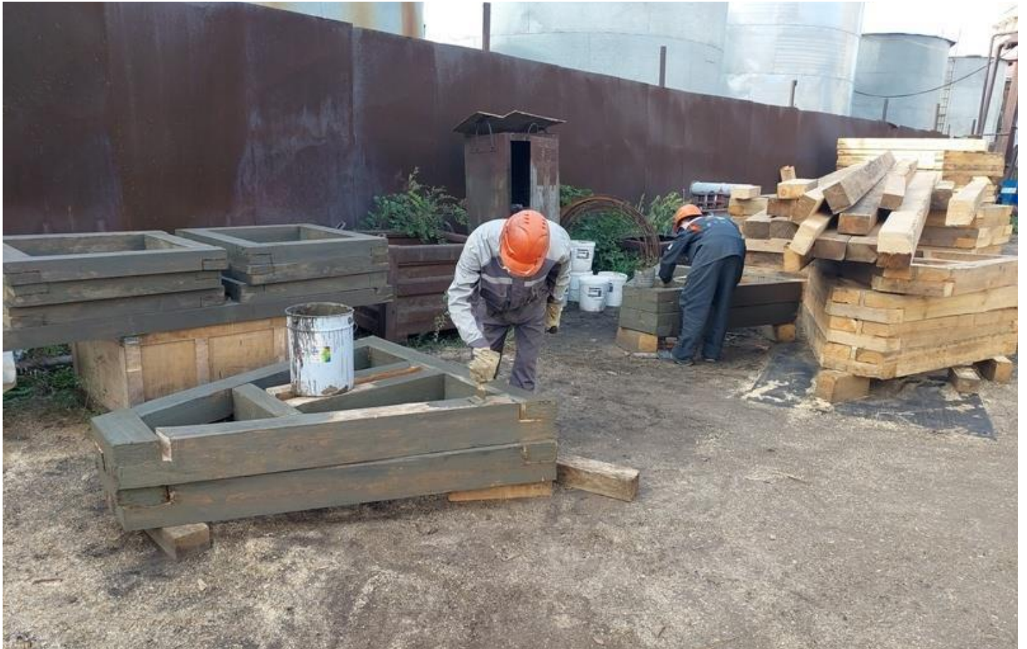
Фото 17 – Изготовление и покраска щитов шатра.