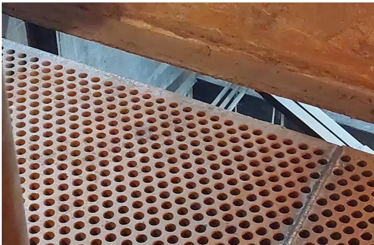
Фото 2 – Обварка кубов