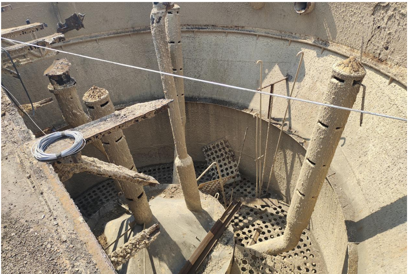
Фото 8 – Демонтаж дефектных металлоконструкции осветителя.