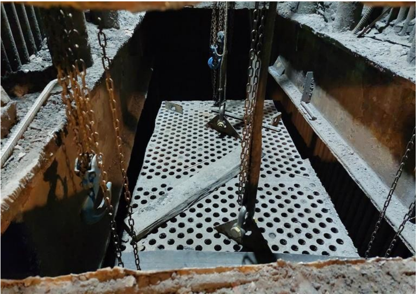
Фото 5 – Монтаж кубов