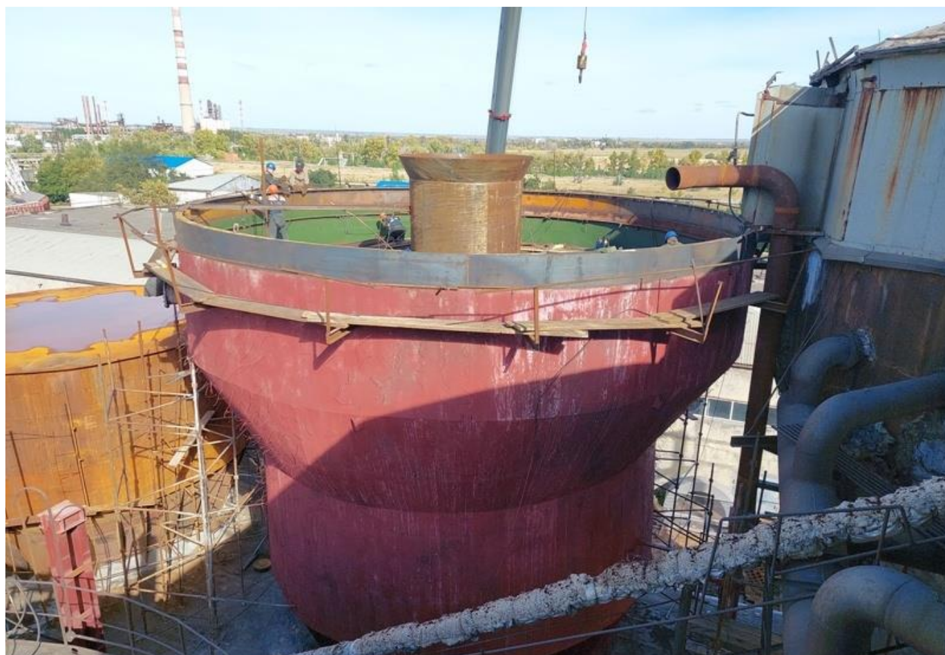
Фото 16 – Монтаж верхней части обечайки.