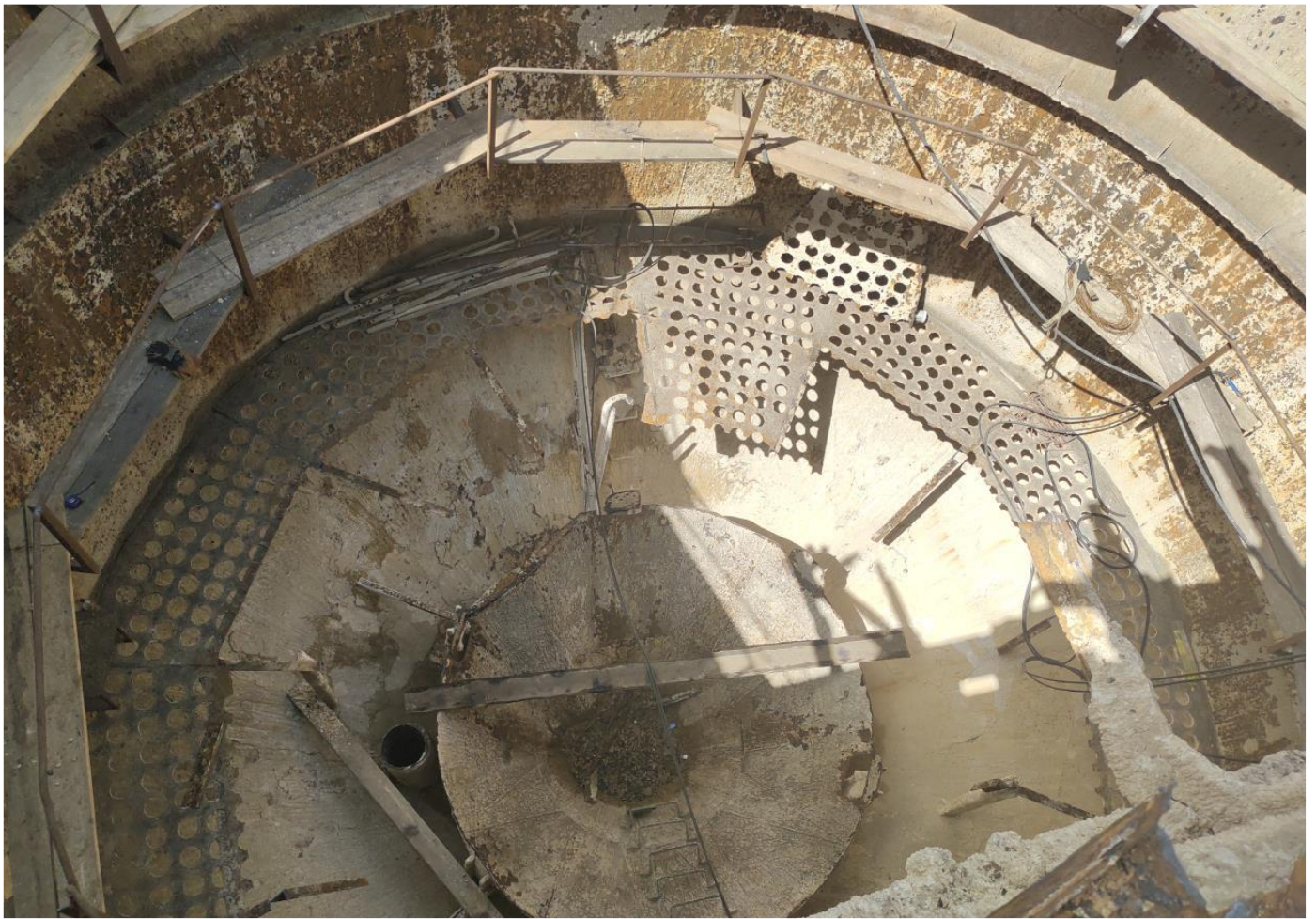
Фото 9 – Корпус осветителя №1 после демонтажа