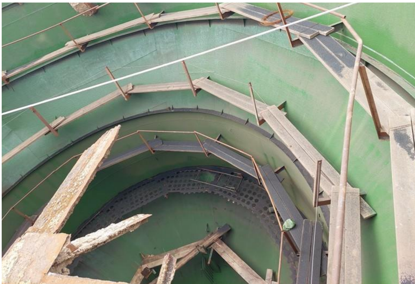
Фото 11 – Антикоррозионное покрытие внутренней поверхности резервуара