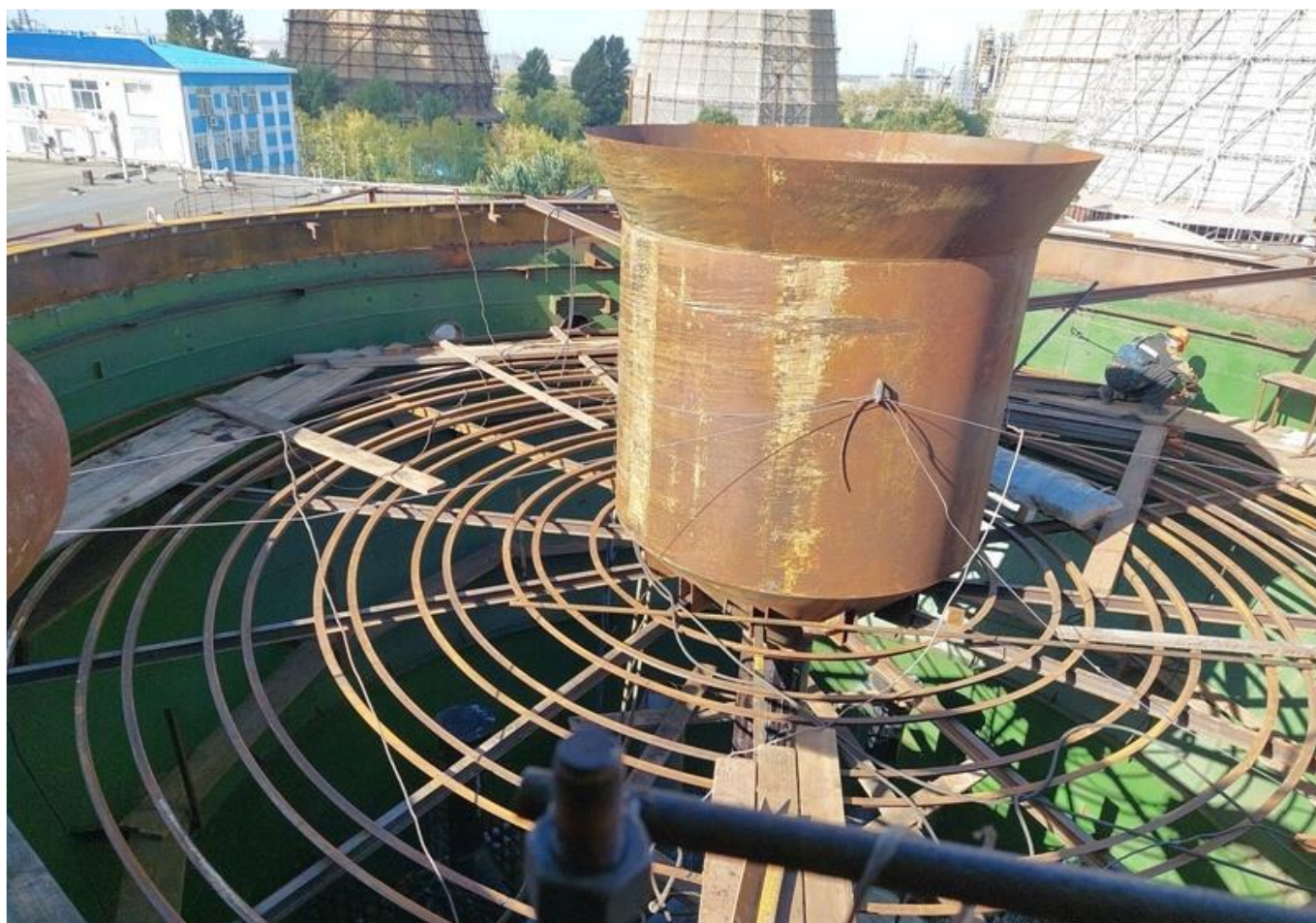
Фото 15 – Монтаж внутренних узлов осветлителя.