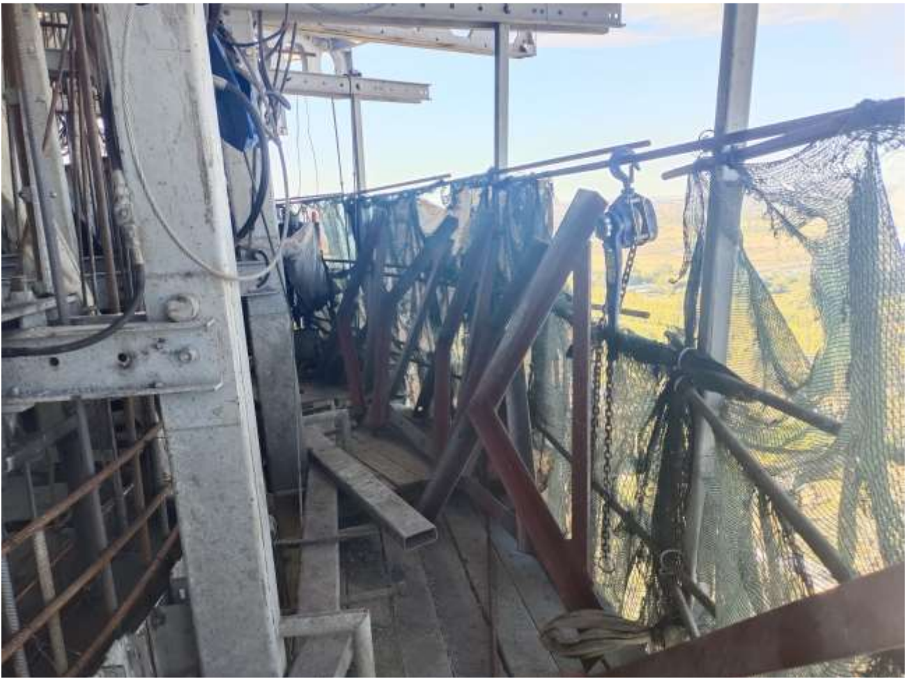
Фото 3 – Наружная рабочая площадка