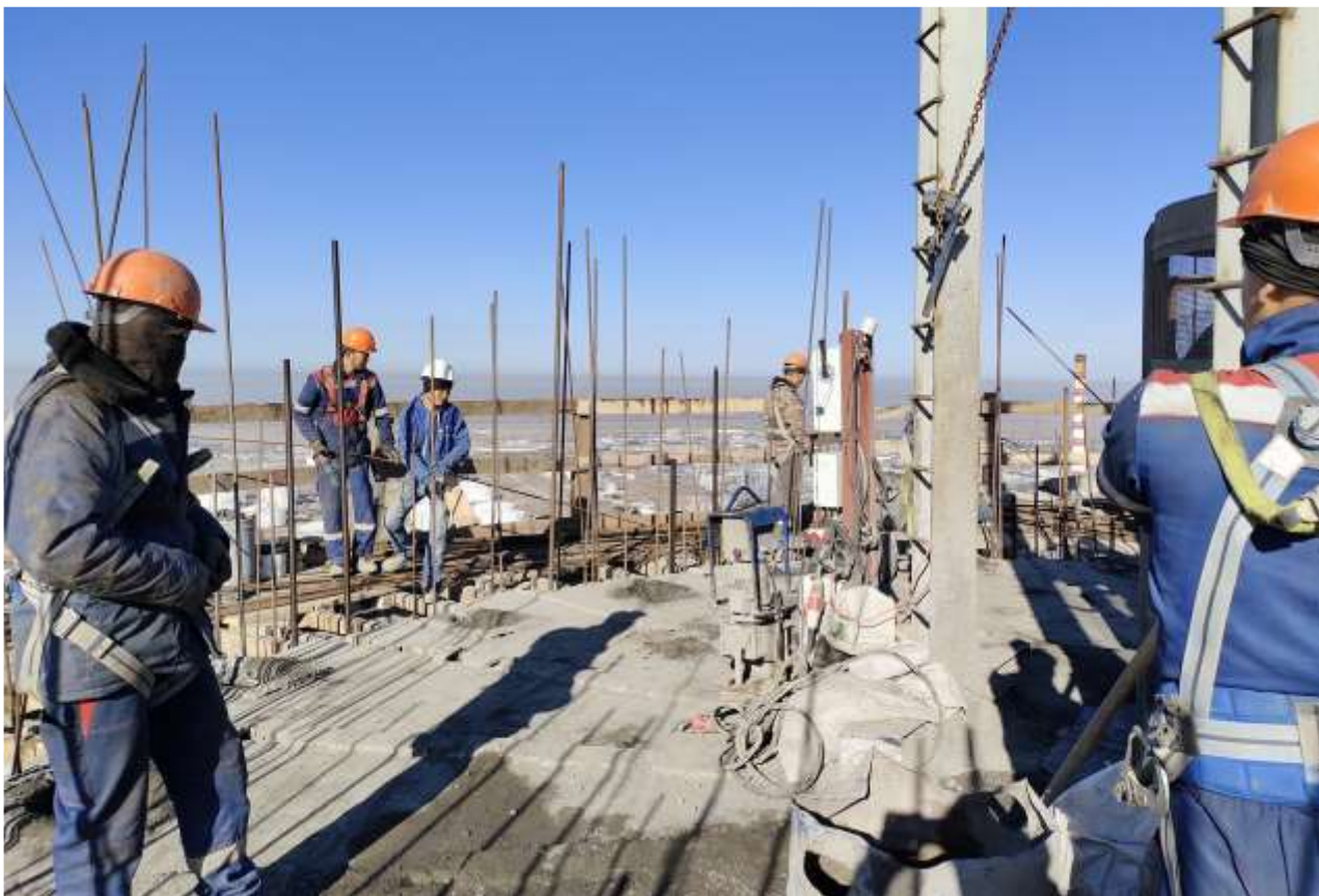
Фото 1 – Верхняя рабочая площадка