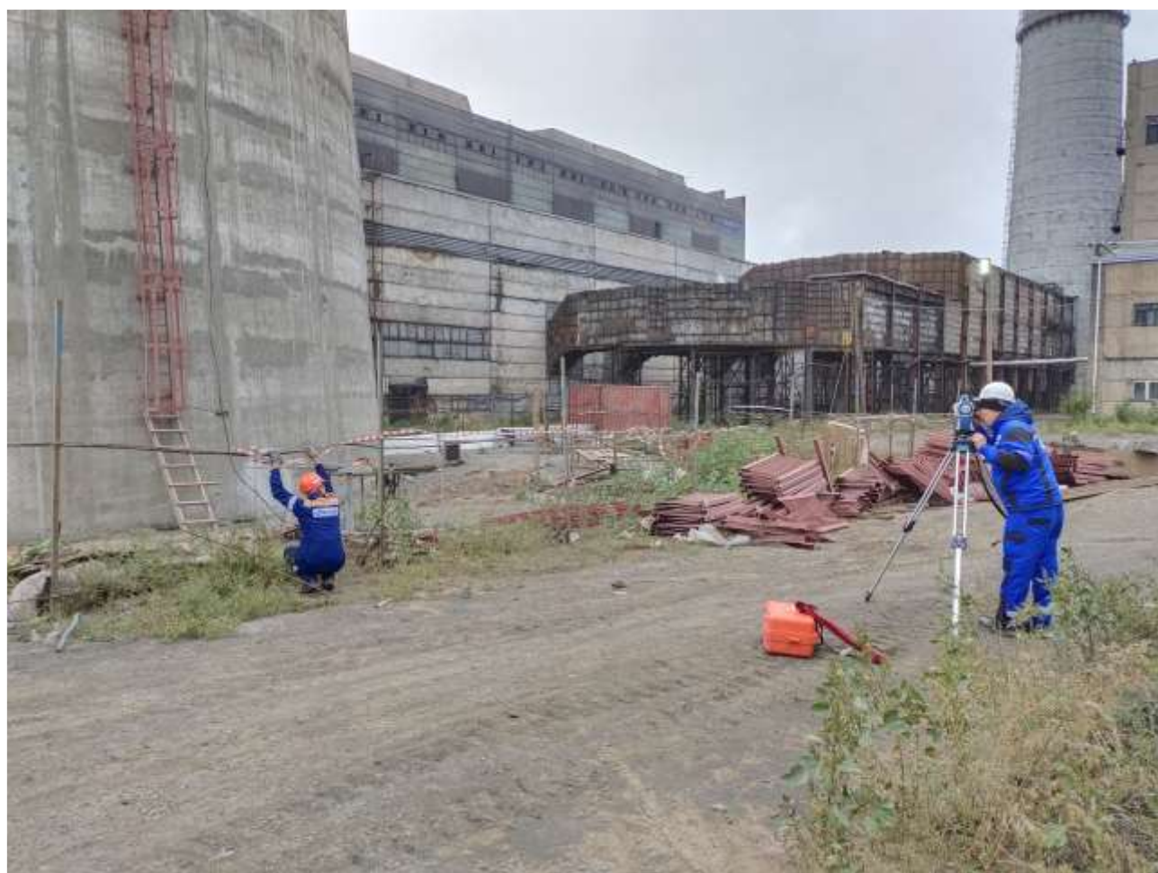
Фото 6 – Геодезический контроль осадки дымовой трубы.