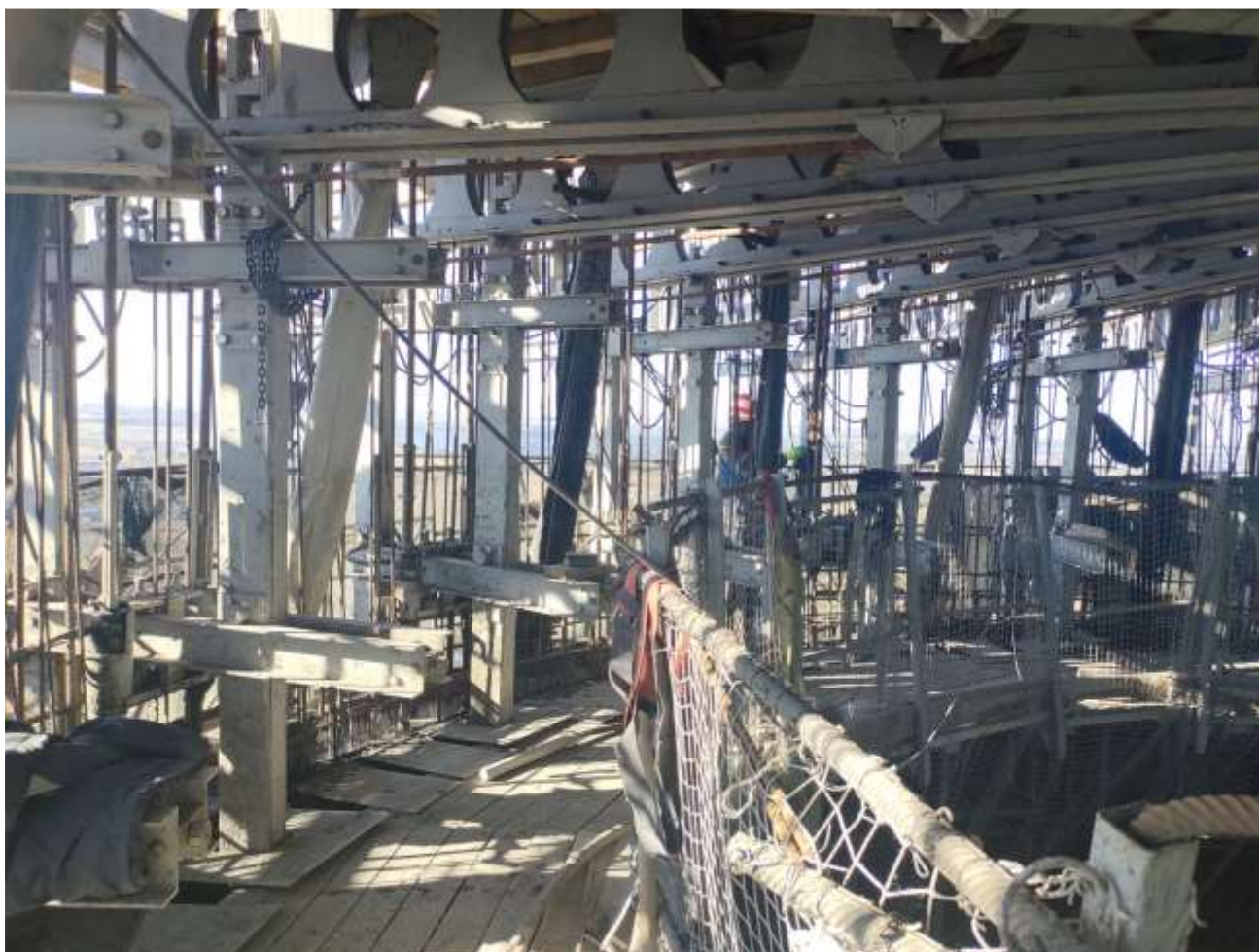
Фото 5 – Внутренняя рабочая площадка