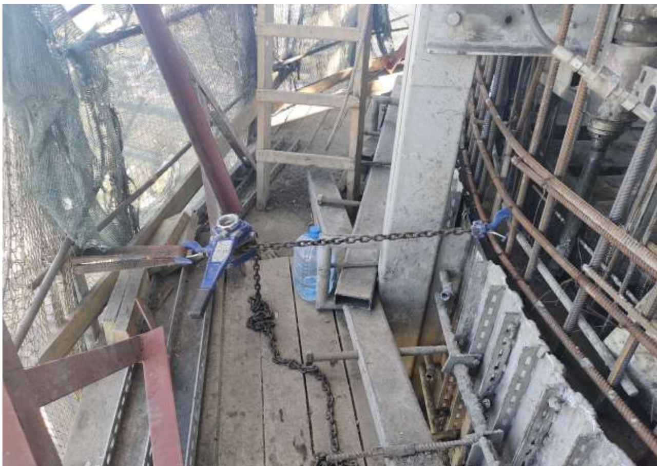
Фото 2 – Наружная рабочая площадка