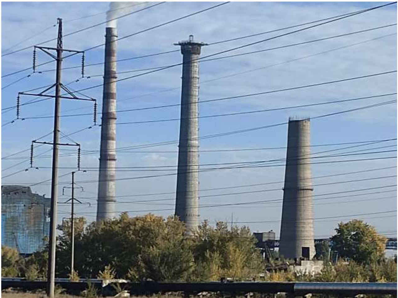
Фото 8 – Дымовая труба отметка +156,000 м.