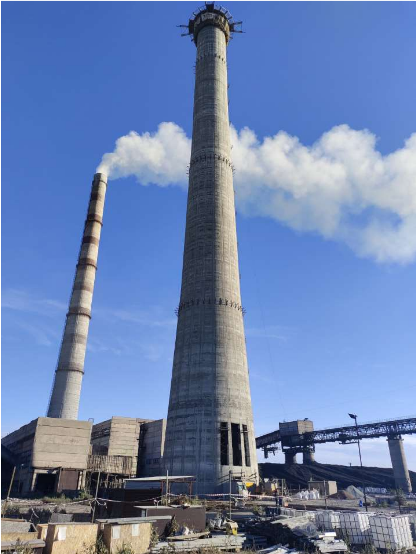
Фото 9 – Дымовая труба отметка +156,000 м.