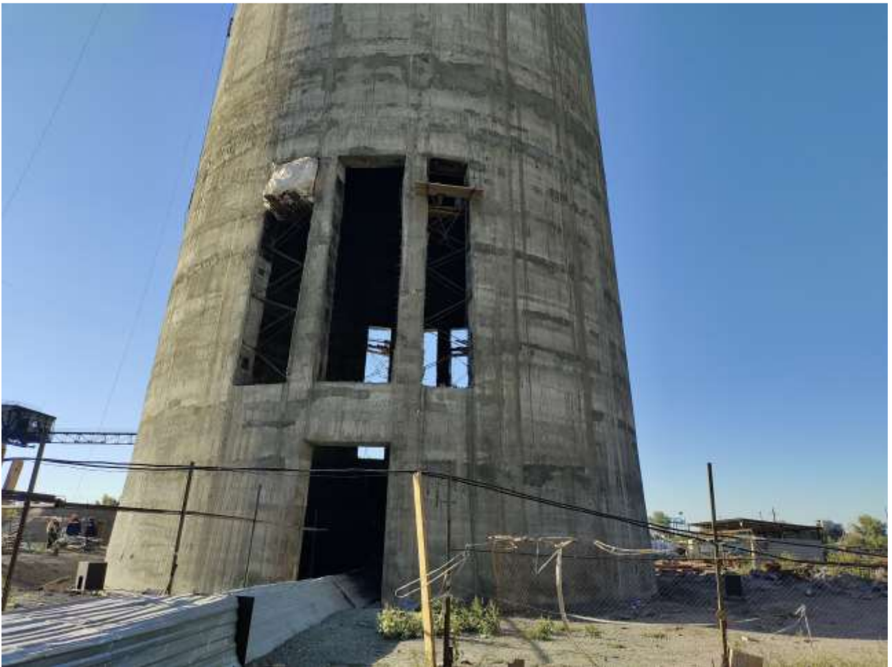
Фото 7 – Усиление проемов газоходов.