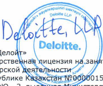
ТОО «Делойт» Государственная лицензия на занятие аудиторской деятельности в Республике Казахстан №0000015, вид МФЮ - 2, выданная Министерством финансов Республики Казахстан от 13 сентября 2006 г.