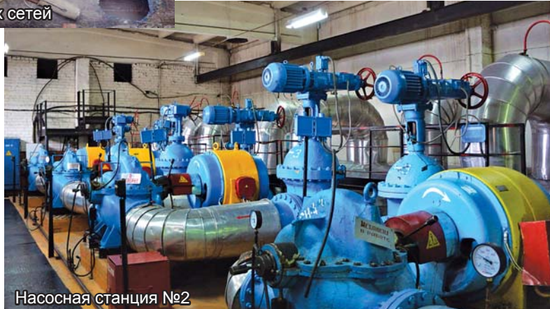
Насосная станция №2

ТОО «Павлодарские тепловые сети» напоминает: в ходе отопительного сезона могут проводиться плановые отключения теплоснабжения и ГВС. Это