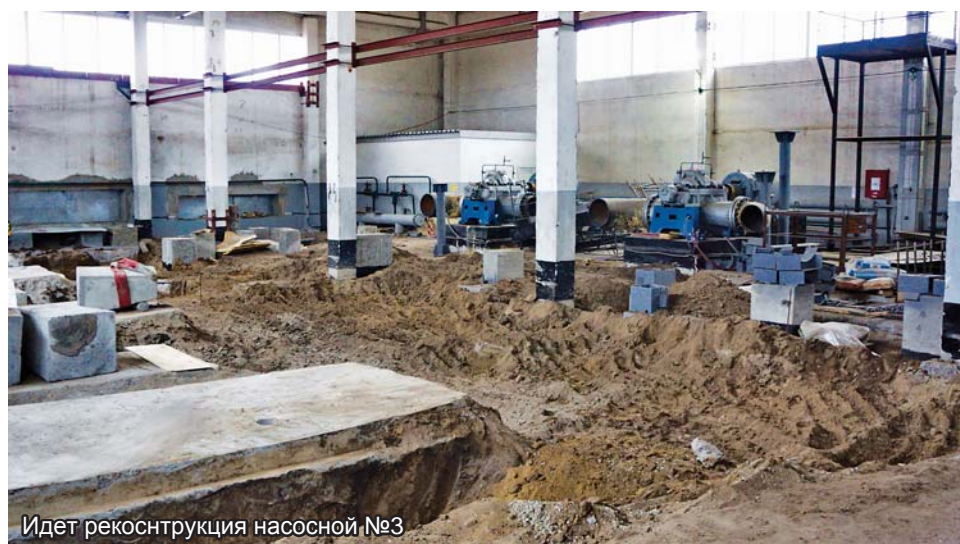
Идет реконструкция насосной №3

связано с выявлением повреждений и их устранением. Тепловики заранее уведомляют о таких случаях через КСК, ДЧС, жилищную инспекцию, ЖКХ, акимат и средства массовой информации.