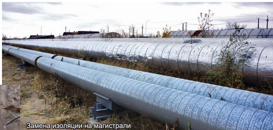
Замена изоляции на магистрали

- Там заменены 250 метров магистрального участка диаметром 600 мм, - объясняет Сергей Панихин. - Также силами подрядной организации «САЭМ-Павлодар» выполнен ремонт участка тепломагистралы № 31 в районе торгового дома «Артур»: заменен трубопровод на предизолированный, при этом увеличен диаметр трубы. В целом же на