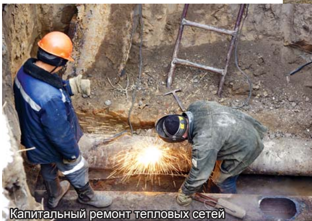
Капитальный ремонт тепловых сетей

В целом все объекты, имеющие те или иные проблемы с теплоснабжением, не остаются без внимания тепловиков. Специалисты проводят проверку оборудования, держат на контроле все