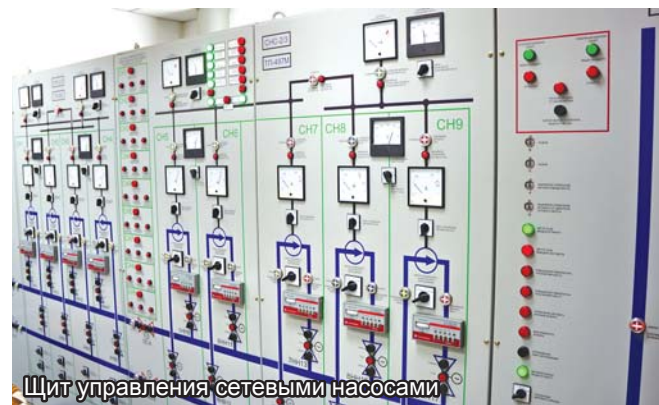
Щит управления сетевыми насосами

ТОО «Павлодарские тепловые сети» напоминает: в ходе отопительного сезона могут проводиться плановые отключения теплоснабжения и ГВС. Это