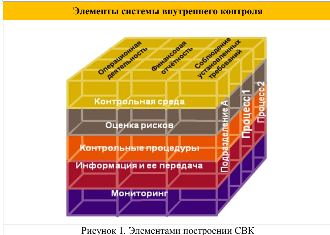
Рисунок 1. Элементами построения СВК

2.3. Элементами, которыми руководствуется Группа при построении СВК, являются (см. Рисунок 1):