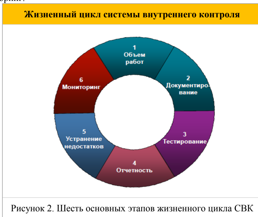
Рисунок 2. Шесть основных этапов жизненного цикла СВК

3.2.3 Детальное описание данных этапов, методов и процедур их организации и выполнения, а также функций, прав и обязанностей субъектов СВК представлено в М-22-03 «Методология организации Системы внутреннего контроля предприятий Группы «ПАВЛОДАРЭНЕРГО»» и РГ-22-01 «Регламент взаимодействий структурных подразделений предприятий Группы «ПАВЛОДАРЭНЕРГО» по Системе внутреннего контроля».